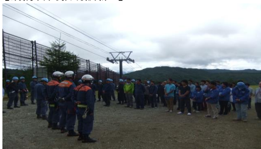
【消防合同救助訓練】