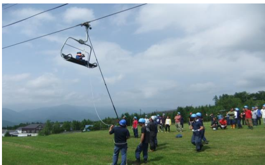
【夏季勤務前救助訓練】