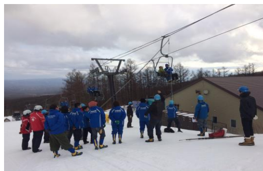
【冬季勤務前救助訓練】